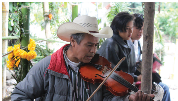
Imagen 4 Música para las máscaras Chapulhuacanito, Tamazunchale, S.L.P. México. Noviembre de 2019

La dinámica que se observa entre los barrios está cruzada por un proceso de conflicto ritual, en el cual hay un momento medular para después