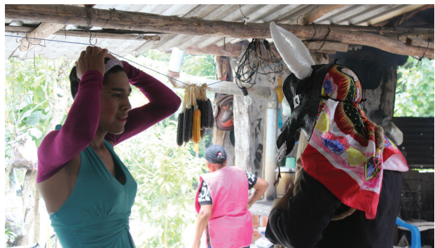
Imagen 12 Tener listo el disfraz para salir Chapulhuacanito, Tamazunchale, S.L.P. México. Noviembre de 2019

Antes de salir a bailar esperan a que se junten más personas, ya que si son más podrán generar un impacto mayor en el barrio y en la comunidad. Mientras esperan, siempre llegan niños de entre siete y 13 años