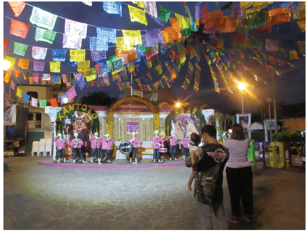
Imagen 1 Chapulhuacanito: lugar de chapulines y de máscaras. Chapulhuacanito, Tamazunchale, S.L.P. México. Noviembre de 2022

rolla una serie de creencias y prácticas (López Austin, 1994: 12). Como lo define Amparo Sevilla, el Xantolo “son días en los que se abre un tiempo sagrado para la celebración de la vida y la muerte” (2002: 6).