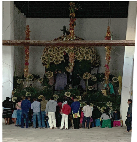
Foto 8 Interior de la iglesia el Miércoles Santo Fotografía: Adriana Guzmán, Mesa del Nayar, 2023.

Dijo también Dios: Júntense las aguas que están debajo de los cielos en un lugar, y describase lo seco. Y fue así. Y llamó Dios a lo seco Tierra, y a la reunión de las aguas llamó Mares. Y vio Dios que era bueno.