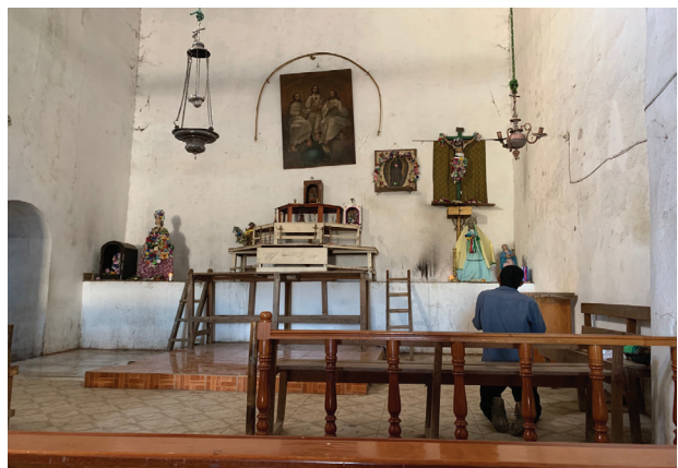
Foto 17 Interior de la iglesia el Domingo de Resurrección Fotografía: Adriana Guzmán, Mesa del Nayar, 2023.

El Domingo de Resurrección finalmente todos los dioses ocupan su lugar habitual en el altar y limpian toda la iglesia (véase foto 17).