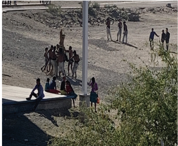
Foto 16 El Judas de zacate montado en un burro Fotografía: Adriana Guzmán, Mesa del Nayar, 2023.

de la comunidad. Poco después, varios judíos ya bañados pero aún con el obligatorio calzón de manta pasean un Judas de zacate montado en un burro (véase foto 16), luego lo tiran al piso, lo rodean y le prenden fuego, le gritan y le avientan cosas.