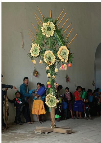
Foto 10 Tenebrario

Después dijo Dios: Produzca la tierra hierba verde, hierba que dé semilla; árbol de fruto que dé fruto según su género, que su semilla esté en él, sobre la tierra. Y fue así. Produjo, pues, la tierra hierba verde, hierba que da semilla según su naturaleza, y árbol que da fruto, cuya semilla está en él, según su género. Y vio Dios que era bueno.