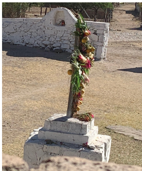
Foto 11 Cruz atrial

Ambos llenos de flores, de la misma manera en la que se encuentra toda la iglesia.