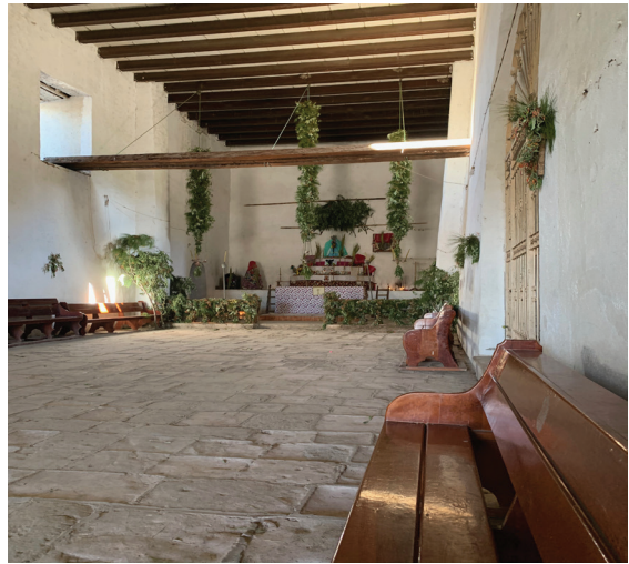
Foto 6 Interior de la iglesia el Viernes de Dolores 32 Fotografía: Adriana Guzmán, Mesa del Nayar, 2023.

el altar mayor, así como las tres largas cuerdas que sostienen al centro un incensario y en cada lado un candelabro, cada uno de los cuales tiene tres velas que deben ser de fabricación local con cera de abeja nativa. Igualmente colocan ramas verdes en la cruz del coro, en las que están sobre las paredes laterales y en la de la pila bautismal, junto a la que colocan más ramas verdes. En el atrio, las amarran en la cruz y en las estaciones del circuito procesional colocan cruces de palma.