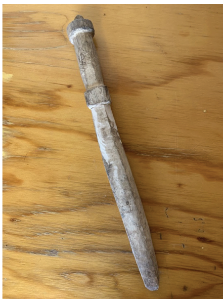
Foto 2 Sable de niño

Mesa del Nayar, 2023.