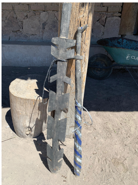
Foto 1 Sables de adultos 25