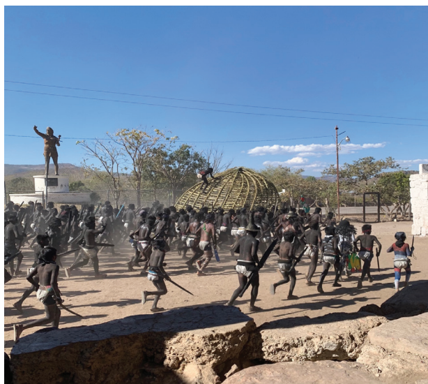
Foto 13 Procesión con “corona” Fotografía: Adriana Guzmán, Mesa del Nayar, 2023.

Después de pintarse, realizan una procesión con la “corona” en andas, arriba de la cual se sube un niño borrado (véase foto 13). En seguida los pintados se dividen en dos grupos. Uno le da la vuelta al pueblo subiendo por el lado sur, y otro hace lo mismo por el norte. Los dos grupos se encuentran al poniente del pueblo, pero esta vez como enemigos. Pasan y se chiflan tres veces uno a otro, a manera de reto, para después entablar una fiera lucha en la que se lanzan bosta y después pelean cuerpo a cuerpo utilizando sables y lanzas. Un grupo vence y al que le dieron “muerte” es resucitado con jugo de limón. Luego de reanimarse, los grupos se trenzan de nuevo en lucha y se emboscan uno al otro. El grupo que fue vencido resulta vencedor en esta ocasión y nuevamente los “muertos” son resucitados con limón.