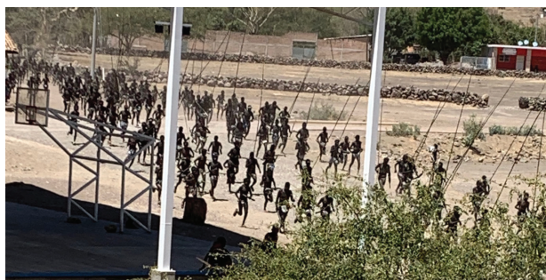
Foto 9 Judíos corriendo a “tomar” la iglesia Fotografía: Adriana Guzmán, Mesa del Nayar, 2023.

A partir de que se borran no se les puede llamar por su nombre, no tienen casa y “pierden” sus relaciones familiares, ya que todos son hijos de Centurión. Los tiznados son seres del mundo de abajo responsables de la creación del mundo; por eso tan larga transformación, por eso su formación militar, pues deben luchar contra la potencia del sol. Dado que en esos tiempos el mundo está invertido –lo de abajo ha cubierto a lo de arriba– deben ser borrados, así como hablar y actuar “al revés”.