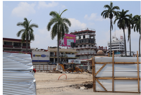
Fotografía 1. Parque Central Miguel Hidalgo cerrado por renovación. Autora, junio 2023.

un país que responde a las demandas restrictivas y de contención de Estados Unidos, pero que en el discurso público se muestra solidario, empático y apegado al ideal humanitario. En este espacio interactúan propósitos y presencias varias vinculadas a la migración: el de las personas en movilidad, aquellos relacionados directamente con la industria de la migración (como coyotes o arrendatarios), también autoridades migratorias, políticas y la población local.