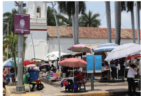
Fotografía 6. Vendimia instalada a un costado del Parque Benito Juárez.

Gran parte de estos vendedores se encuentran todavía varados en la ciudad esperando una resolución ante su solicitud de refugio: “sin trabajo no hay dinero, y sin dinero no hay más que hacer que sentarte a buscar sombra y esperar” (B., comunicación personal, 2021).