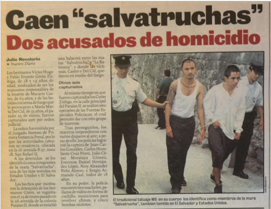
Imagen 4 Nuestro Diario, 15 de marzo de 1998: 4.

En Nuestro Diario , el primer cuerpo tatuado desvestido para ser fotografiado con el propósito expreso de exponerlo apareció el 23 de agosto de 1998. Aquella ocasión el periódico informó de una requisita policial en prostíbulos de la capital. La noticia estableció que seis mareros acusados de robar y reñir en el centro de la ciudad habían sido capturados. Aunque el título sintetiza el parte policial de la requisita, la fotografía de mayor extensión incluida en la noticia retrata a un hombre sin camisa con la parte superior del cuerpo cubierta de tatuajes, sometida a la misma técnica de manipulación que la fotografía de la portada de Al Día del 13 de mayo. En la nota al pie se establece que: “los ‘Salvatruchas’ tienen el cuerpo lleno de tatuajes diabólicos” (Cortez, 1998: 5).