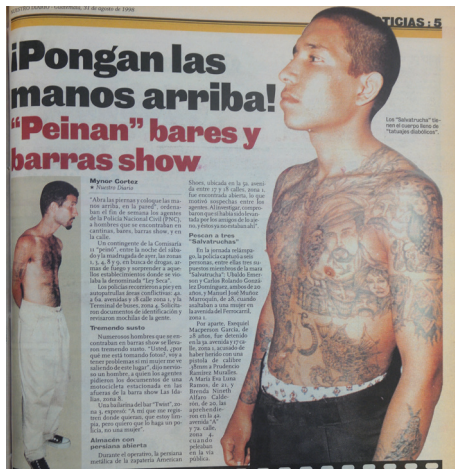
Imagen 5 Nuestro Diario, 31 de agosto de 1998: 5.

En Nuestro Diario , el primer cuerpo tatuado desvestido para ser fotografiado con el propósito expreso de exponerlo apareció el 23 de agosto de 1998. Aquella ocasión el periódico informó de una requisita policial en prostíbulos de la capital. La noticia estableció que seis mareros acusados de robar y reñir en el centro de la ciudad habían sido capturados. Aunque el título sintetiza el parte policial de la requisita, la fotografía de mayor extensión incluida en la noticia retrata a un hombre sin camisa con la parte superior del cuerpo cubierta de tatuajes, sometida a la misma técnica de manipulación que la fotografía de la portada de Al Día del 13 de mayo. En la nota al pie se establece que: “los ‘Salvatruchas’ tienen el cuerpo lleno de tatuajes diabólicos” (Cortez, 1998: 5).