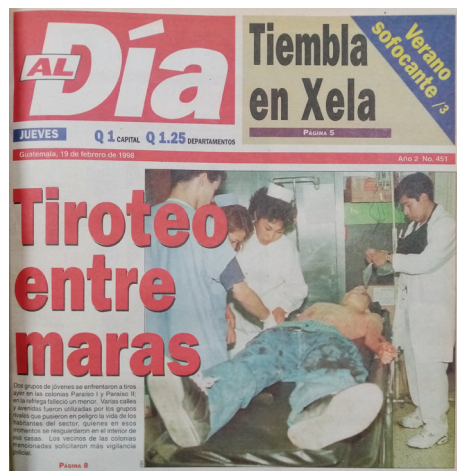
Imagen 2 Al Día , 19 de febrero de 1998.

Al Día comenzó a circular en noviembre de 1996. Si bien desde el principio presentó noticias de maras, estas solo llegaron a las portadas durante la cobertura de la guerra a las maras. En la edición del día 19 de febrero de 1998, el diario informó de un “tiroteo entre maras” acaecido en una barriada popular en el norte de la capital. La fotografía de la portada muestra a un hombre recostado en una camilla de hospital con el torso