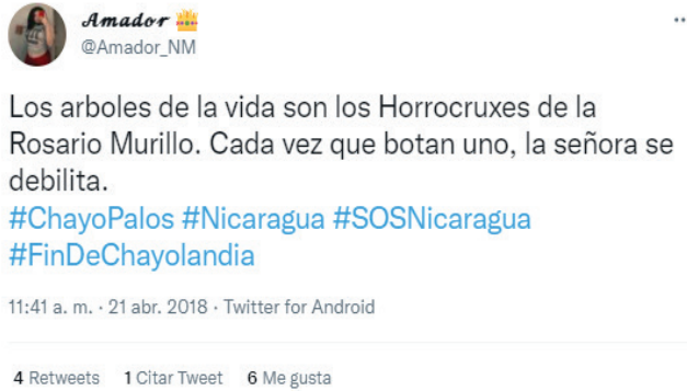
Figura 1. Tuit recuperado del primer levantamiento de abril de 2018 contra el gobierno liderado por el presidente de Nicaragua Daniel Ortega y la vicepresidenta Rosario Murillo.

como “los árboles de la vida” y que habían sido muy publicitados por Rosario Murillo, la vicepresidenta y esposa de Daniel Ortega.