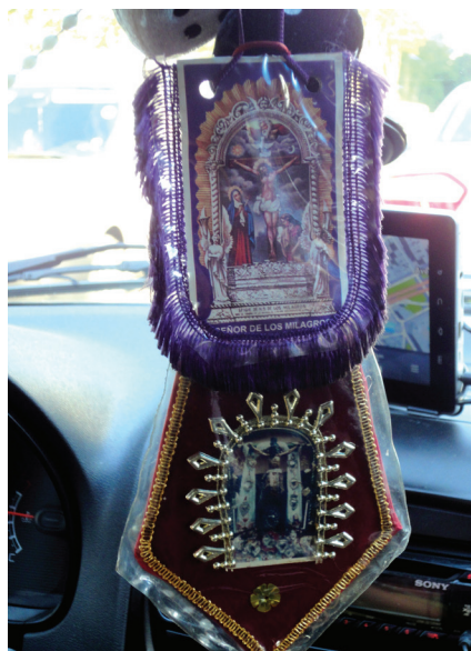
Imagen 24. Cristo de los Milagros de Lima y Señor de Canchapelca (28/11/2014)

De manera algo esperable, registré una imagen del Señor de los Milagros –la principal devoción peruana, a la cual también se le rinde culto en la ciudad mediante una procesión anual–, pero también otras más regionales que testimoniaban las ciudades de origen de los conductores. Así, fotografié, entre otros, al Señor de Canchapelca (de la ciudad homónima), al Señor de Luren (ciudad de Ica) y a la Virgen de la Puerta (ciudad de Otuzco). Esta Virgen también tiene una imagen entronizada en la Catedral de La Plata (la capital de la provincia de Buenos Aires), cuya fotografía el conductor llevaba en su celular y me mostró orgulloso (imágenes 24, 25 y 26).