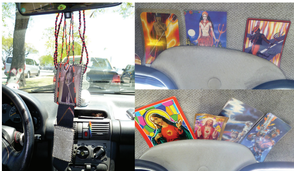
Imagen 42: Colgante de San La Muerte, collares de Exú. Estampitas de Exú (2), Pomba Gira, Sagrado Corazón de Jesús (2), Oiá y Ogún (1/11/2011)

Tuve dos encuentros con conductores que reconocieron que practicaban religiones afro . El primero fue bastante excepcional, ya que el taxi era conducido por una mujer (algo no tan común) y, además, porque fue la única que tenía un colgante muy visible de San La Muerte. 16 A los costados, entre ambas puertas y el parabrisas, tenía estampitas de los orixás afrobrasileros. Me dijo que era hija de Oiá, y que vivía en un templo de religión afrobrasilerera en la ciudad, algo también poco común, ya que la mayor parte de los templos están en el área conurbada (imagen 42).