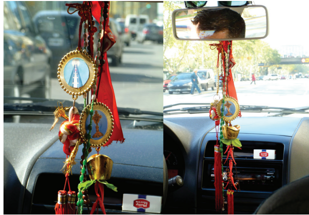
Imagen 10: Virgen de Huanchana y Señor (Cristo) de Mailin (8/4/2013)