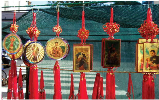
Imagen 6: Colgantes feng-shui con santos católicos y cintas rojas. Puesto de venta en la acera de la iglesia de San Jorge, en su festividad (23/4/2009)

en los alrededores de la basílica de Luján, y no en la tienda oficial del Santuario. 10 Puestos similares se arman en la calle o en la acera alrededor de las iglesias donde hay fiestas de los santos más populares (San Cayetano, San Expedito, San Jorge) o en festividades de advocaciones de la Virgen (San Nicolás, Desatanudos, Medalla Milagrosa). Estos puestos constituyen un verdadero circuito comercial y masivo de artículos religiosos, que incluyen elementos simbólicos que no son aprobados por la Iglesia, por no pertenecer a la tradición católica. Su función en la resignificación (y en el reenmarcamiento, reframing ) de símbolos católicos y en la transmisión de significados mágico-religiosos muy heterodoxos no ha sido suficientemente estudiada (pero ver Algranti, 2016, para una excepción) (imágenes 5 y 6).