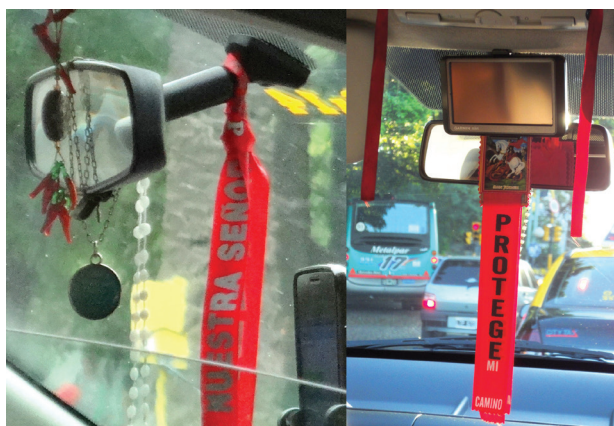
Imagen 4. Cuernitos, cinta roja de la Virgen de Luján, rosario, dos medallas sin identificar (26/11/2018) y cinta de San Jorge “Protege mi camino” (5/2/2013)

Es muy probable que este tipo de cintas se comercialice principal o exclusivamente a través de los numerosos puestos de venta de imágenes religiosas y souvenirs/merchandising religiosos de todo tipo que se encuentran