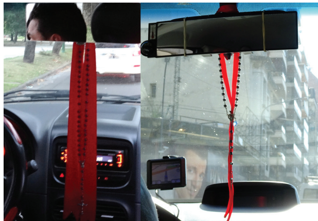
Imagen 1. Cintas rojas y rosarios (25/2/2015 y 20/7/2017)

Por el mismo motivo protector también se puede encontrar un cuernito rojo ( cornicello napolitano ), que cumple las mismas funciones. Fruto de nuestra herencia cultural itálica, el cuernito tiene una presencia antigua